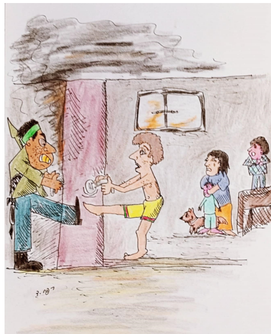
ציורים מאת רפי דגן